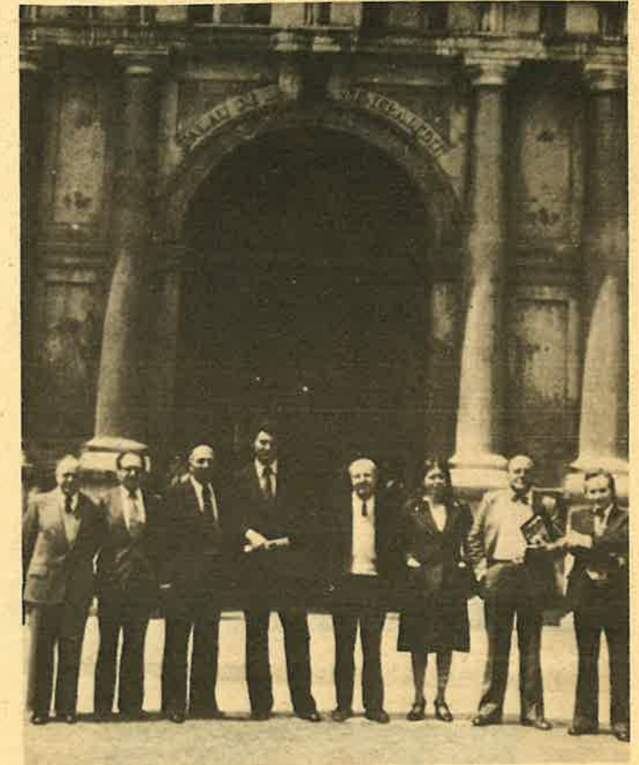
Los diputados y senadores elegidos deben de negarse a participar en el «Consejo General» y se han de comprometer a constituir la Asamblea de Parlamentarios Catalanes.