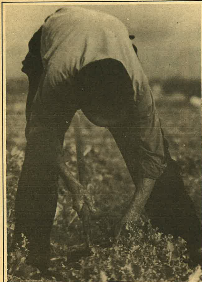
El campo ha sido mano de obra barata para el fascismo.